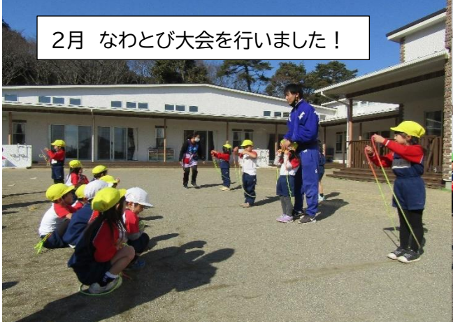
2月 なわとび大会を行いました！