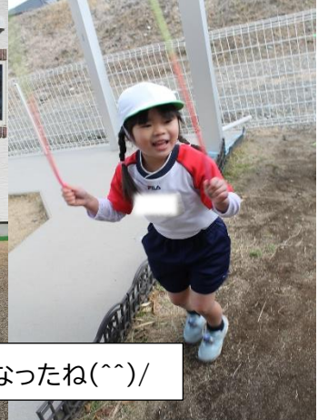
たくさん跳べるようになったね(^^)/