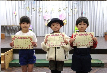
表彰式もして、みんなから拍手をもらいました*おめでとう！