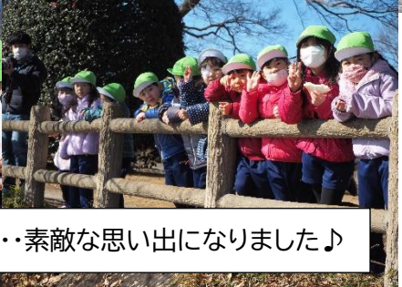
白鳥にパンをあげたり、絵を描いたり・・・素敵な思い出になりました♪