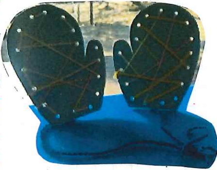
毛糸を通してきぼてぶくろができました