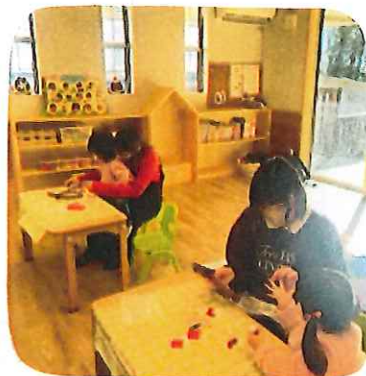
新しい年におめでとうおめでとう しました！